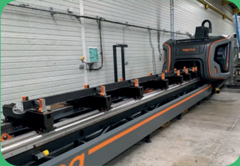
Deux nouvelles machines sont venues moderniser le parc du service pré-usiné en 2022