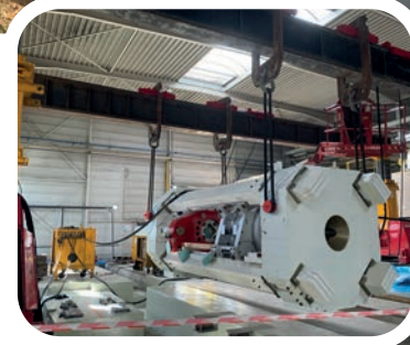
Extension du bâtiment pour accueillir une seconde presse d'extrusion de 2.200 tonnes